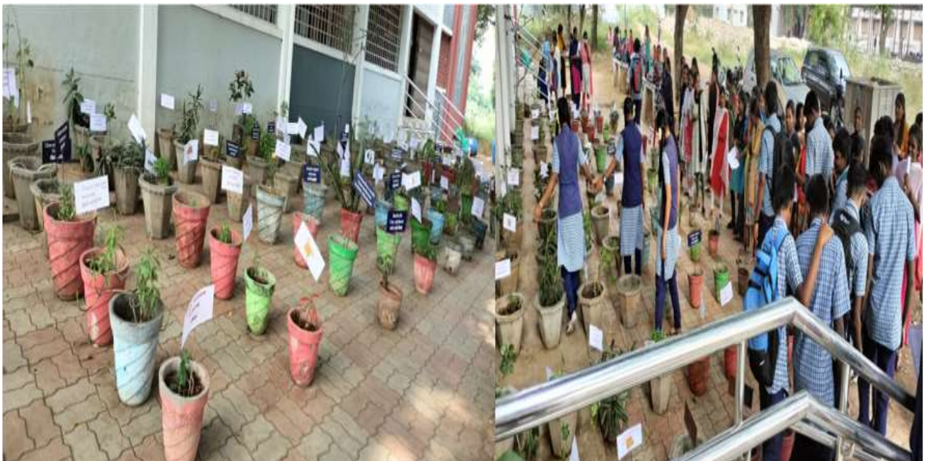
Government School students visited medicinal plants exhibition