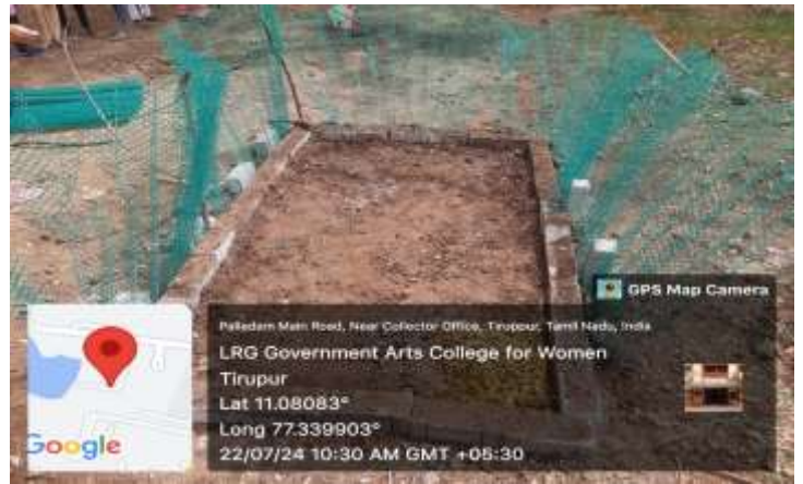
Vermicomposting at our campus