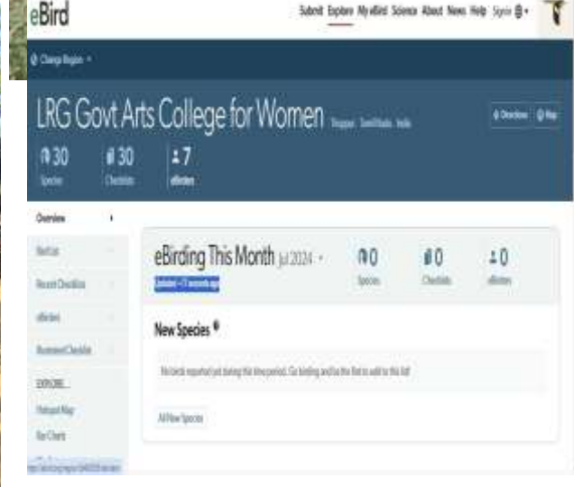
Bird watching at campus